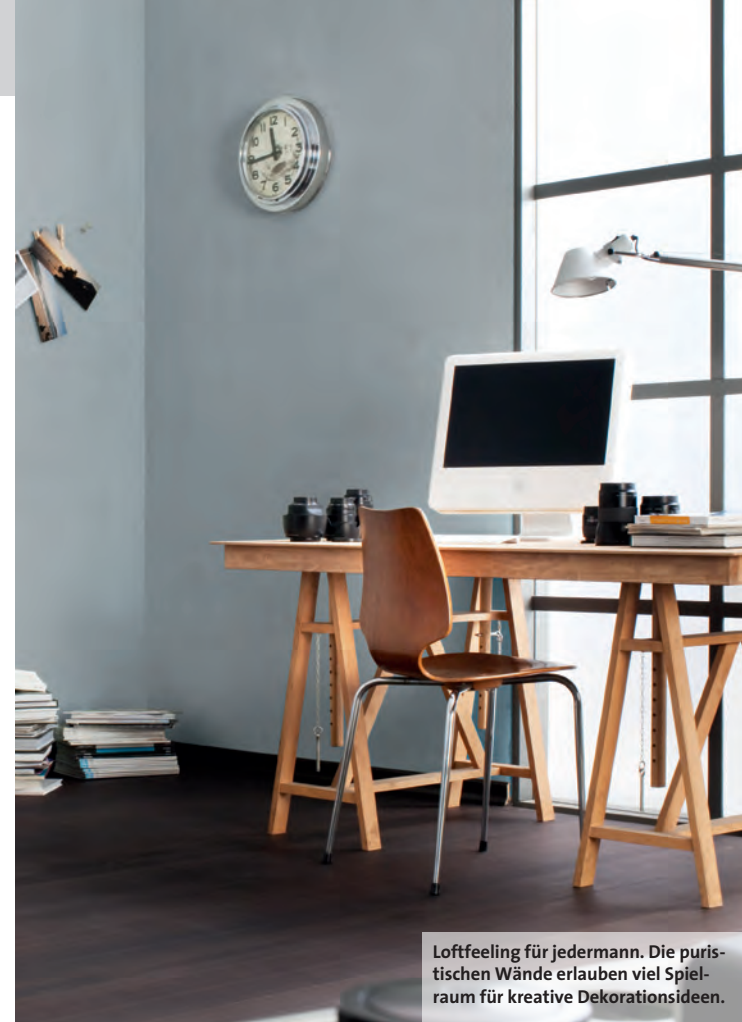
Loftfeeling für jedermann. Die puristischen Wände erlauben viel Spielraum für kreative Dekorationsideen.

Verteilen Sie den Effektpachtel direkt im Anschluss mit dem Beton-Optik Glätter kreuz und quer ohne Rhythmus und ziehen Sie das Material an den Erhebungen des zuvor aufgetragenen Grundspachtels ab. Je mehr Druck Sie dabei ausüben, desto mehr schimmert der Untergrund durch und gibt die gewünschte Optik wieder. Anschließend tragen Sie das Material auf den nächsten 1–2 m 2 auf und verteilen es auf dieser Fläche. Um Ansätze zu vermeiden, rollen Sie beim Auftragen der Folgefläche immer leicht in die zuvor strukturierte Fläche hinein (nass in nass).